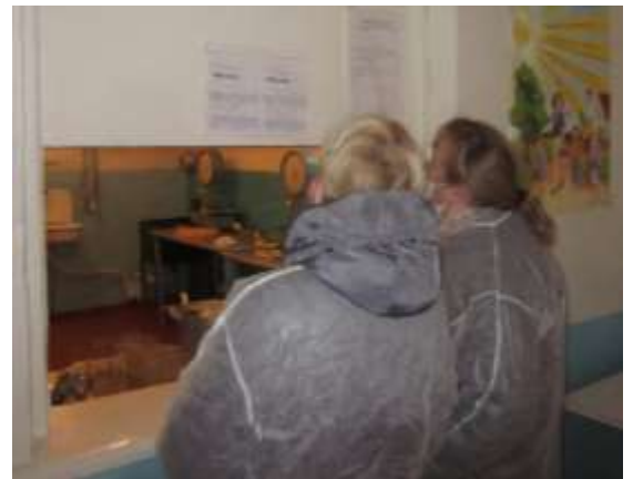
Родители изучают меню