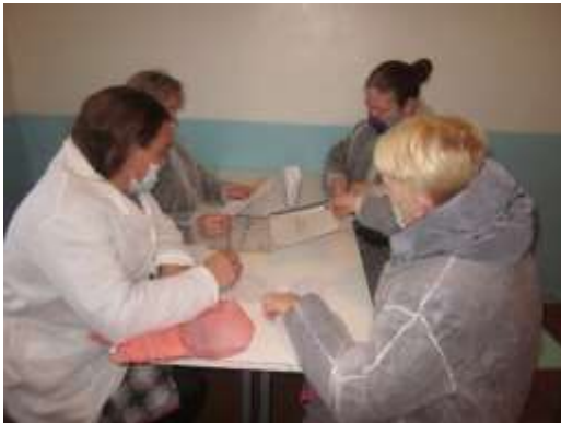
Проверка бракеражных журналов