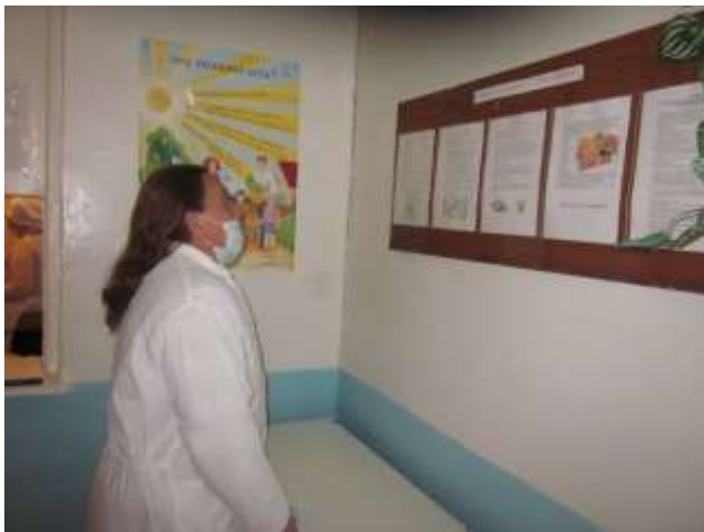
У стенда «Здоровое питание»

В целом организация школьного питания получила высокую оценку родителей. Родителям было предложено заполнить специальные карточки, в которых необходимо было оценить работу школьной столовой по десяти параметрам, определенных совместно с родителями: свежесть пищи, запах, масса порции, температура блюд, сервировка стола, температурный режим в столовой, наличие меню, наличие информации о вкусной и здоровой пище, своевременность проб, заполнение журнала бракеража. В карточках проверяющего (прилагаются) не было ни одного минуса.